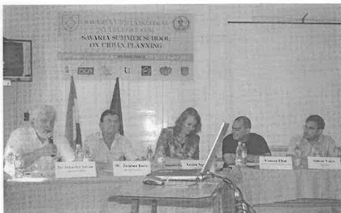
A 2007-es szemeszter zárónapján együtt ültek az előadói asztal mögött az urbanisztikai tanuló főiskolások és tanáraik. On the last day of the semester in 2007 the college students of urbanistics are sitting together with their teachers