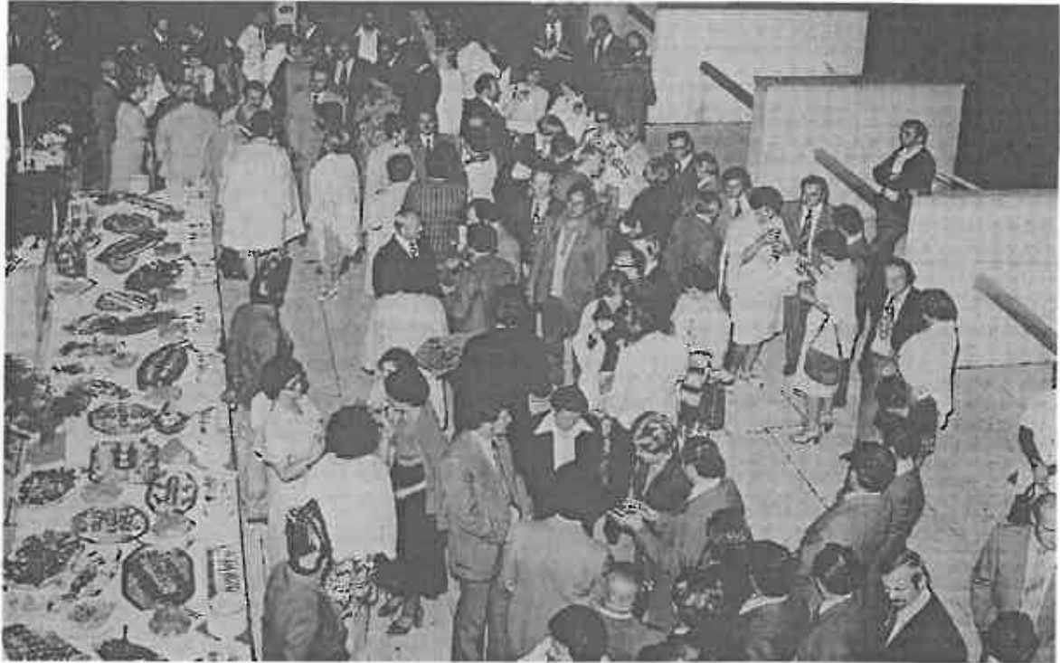
Fogadás 1978-ban, a Savaria Urbanisztikai Nyári Egyetem vendégeinek köszöntése a Claudius Szálló tetőteraszán Welcome reception in 1978 for the participants of the Savaria Summer School for Urban Studies on the flat roof of Hotel Claudius