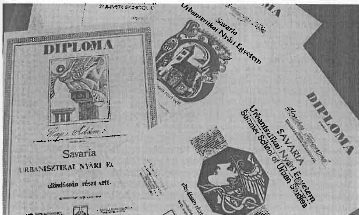
A nyári egyetem diplomája jó emlékek és tapasztalatok őrzésére jogosít The diploma awarded at the Summer School helps participants cherish their memories and recall their experience