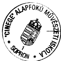
Horváth Károly igazgató

A költségvetés végrehajtásáról külön beszámoló szól.