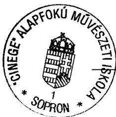
Horváth Károly mb. igazgató

A költségvetés végrehajtásáról külön beszámoló szól.